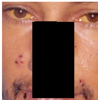
Fig. n° 3: Forma clínica de Leptospirosis con

Laboratorio: Hto 36%, Hb 10.2, GB 13.000 x mm 3 (con predominio neutrofílico), plaquetas 10.200 x mm 3 , ERS 105, urea 83 mg/dl, creatinina 3.8 mg/dl,