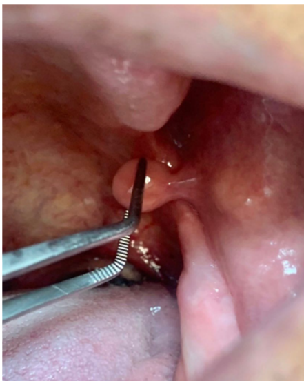
Fig.1 Aspecto clínico de la lesión.

En la revisión de antecedentes médicos el paciente no relató alteraciones de relevancia. Se constató el uso de prótesis completas en ambos maxilares. Al examen clínico se observa dicha lesión única, indolora, de color rosado, de aproximadamente 1 cm de diámetro, de forma redondeada, contorno regular, liso y brillante, de consistencia fibrosa, móvil y con una base pediculada. El diagnóstico presuntivo fue hiperplasia fibrosa.